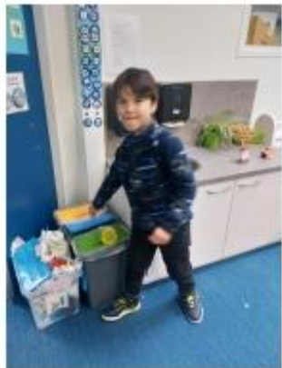
Cesur gooide proactief het afval wat hij zag in de prullenbak, het was niet van hem.